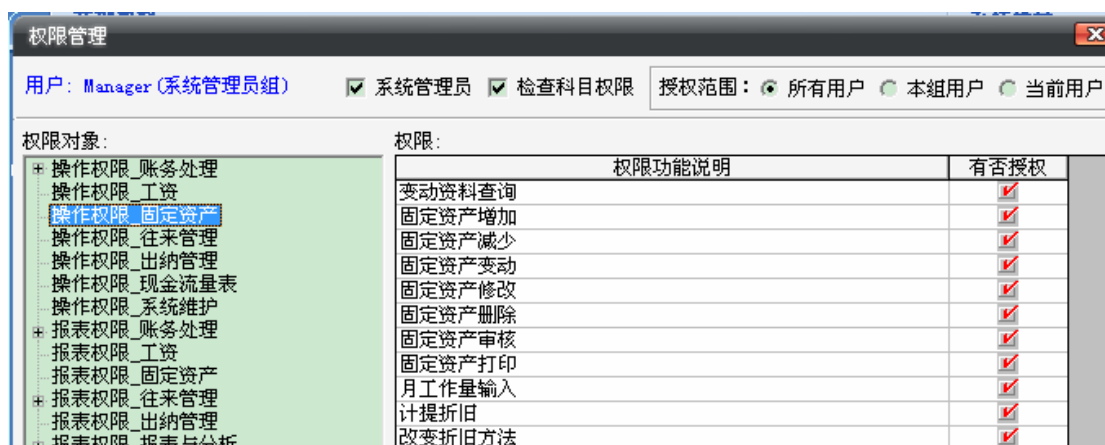
图 1-07 固定资产方面的授权

4、在【系统维护】→【用户管理】中对用户授予固定资产方面的相关权限，【工资管理】模块的权限设置与此类似，如图 1-07：