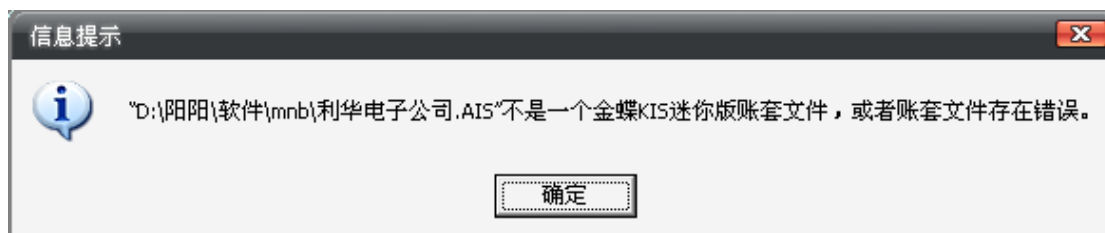
图 1-05 标准版账套在迷你版中打开报错

3、在标准版中重新录入固定资产卡片，此时单击【固定资产增加】会提示“没有权限”，如图 1-06：