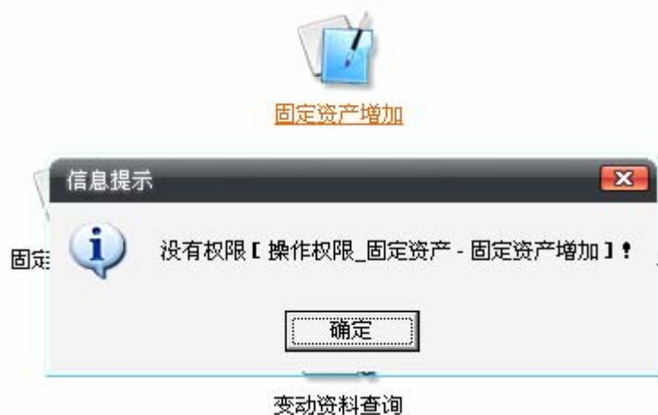
图 1-06 没有固定资产模块的操作权限

3、在标准版中重新录入固定资产卡片，此时单击【固定资产增加】会提示“没有权限”，如图 1-06：